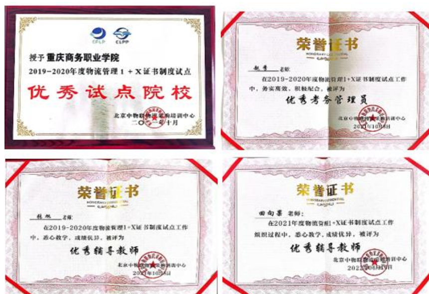
图 2-9 物流管理 1+x 证书相关荣誉

三是以学生社团为抓手，课余活动特色化。学生社团是现代物流管理专业第二课堂载体，定期组织“商院杯”智慧物流作业方案设计与实施大赛、供应链沙盘模拟大赛、物流企业调研、助力双十一快递等活动，把教学内容运用于实战中、比赛中，有效提高了学生的综合素质，对课程教学形成有力补充。