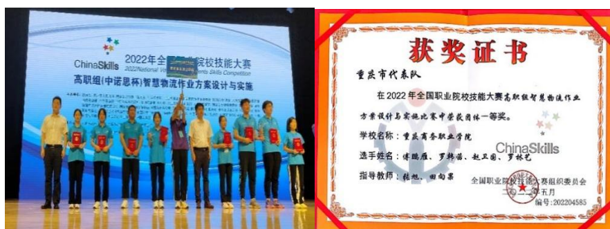
图 2-8 学校获全国职业院校技能大赛一等奖

一是以技能提升为目标，课赛训一体化。物流管理专业对接全国职业院校技能大赛标准，构建以全国职业院校技能大赛为引领，以“巴渝工匠”杯系列竞赛等为主体，以“一带一路”金砖国家技能大赛、行业职业技能竞赛为补充，校级技能竞赛全覆盖的“1+1+N”职业技能竞赛体系，协同开展“课赛训”一体化教学，以赛促学、赛训并举。