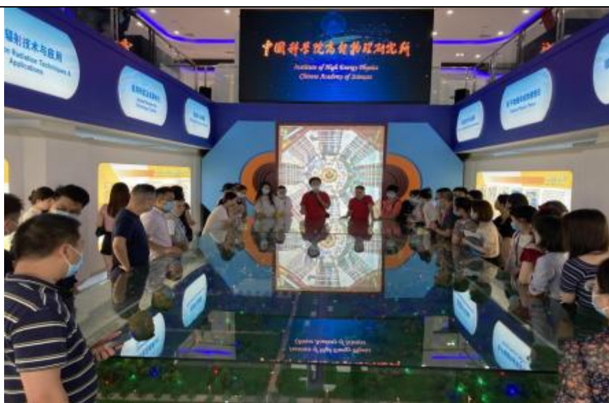
图 6-1 重庆商务职业学院师生走进中国科学院高能所

四是创设专业教学平台、引进优质课程与教师资源。联动中科重庆大数据技术应用研究院，面向中科系企业通过人工智能、大数据、学习模型等新一代信息化技术，研发出具有角色权限设置、课程计划管理、课程资源共享、智能在线测验、线上主机实验、智能学习状态检测、在线测试与答疑、个性化学习情况分析等功能的一体化教学平台，为师生互动和交流学习搭建起一座全新的桥梁和渠道，服务于“中科卓越班”师生日常教学、交流，极大的提升了教学效率和效果。中科重庆大数据技术应用研究院根据重庆商务职业学院专业发展要求，性引进高端人才 9 名，持续强大“中科卓越班”课程资源和教师资源。