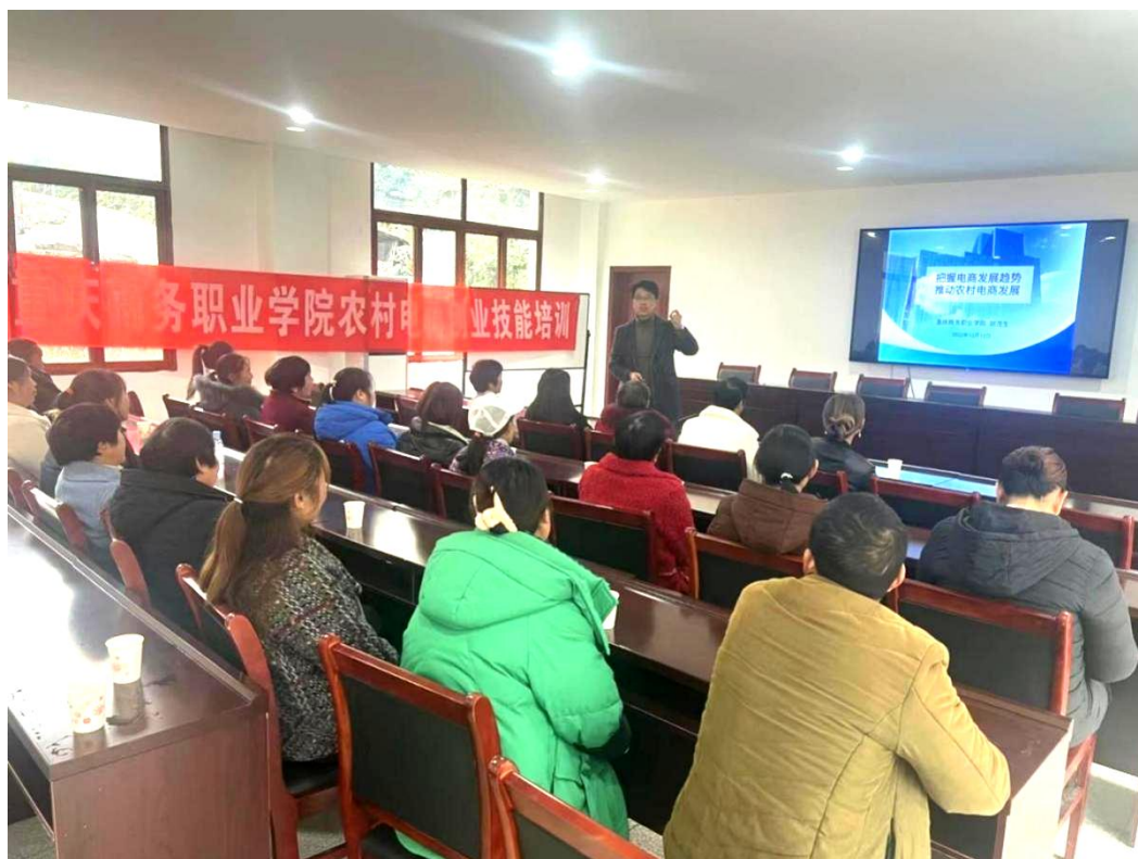
图 3-3 学校教师为城口村民开展电商技能培训