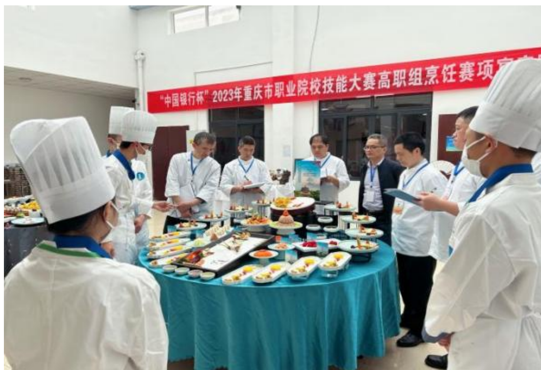
图 2-7 学校承办 2023 年重庆市职业院校学生技能大赛