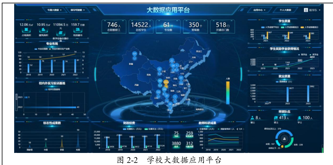
图 2-2 学校大数据应用平台