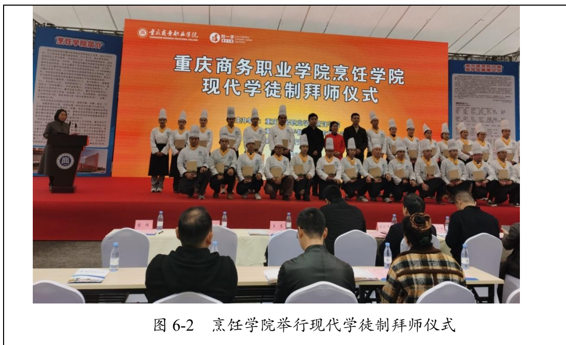
图 6-2 烹饪学院举行现代学徒制拜师仪式