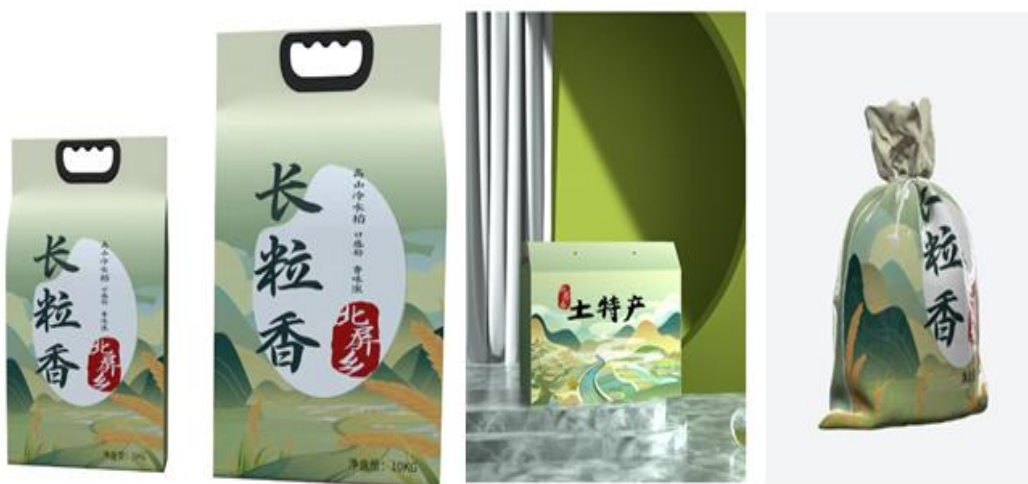
图 3-4 学校为北屏乡农产品提供不同类别型号的包装设计

3.3.4 特色活动提升帮扶成效。一是组织大学生深入城口县开展电商直播知识宣讲，传递爱国情怀，关爱留守儿童，慰问孤寡老人等“三下乡”社会实践等志愿者服务活动。二是为咸宜镇中心小学、北屏乡和龙田乡开展心理健康送教下乡