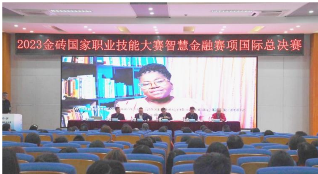
图 2-6 学校承办 2023 金砖国家职业技能大赛智慧金融赛项国际总决赛

二届职业技能大赛重庆市选拔赛烘焙等 12 个项目的比赛。此外，全力推进竞赛基地建设，成功立项烘焙、烹饪（西餐）、印刷媒体技术、酒店接待 4 个项目的重庆市级职业技能竞赛选拔集训基地。