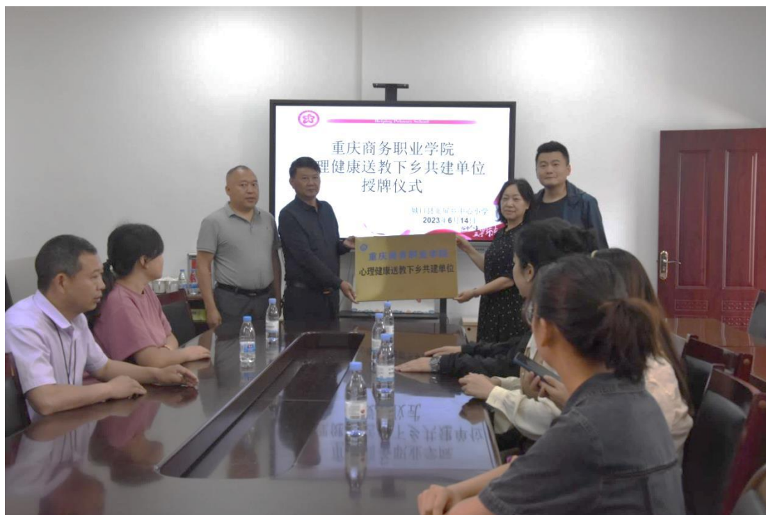
图 3-6 与北屏乡中心小学建立心理健康送教下乡共建单位授牌仪式