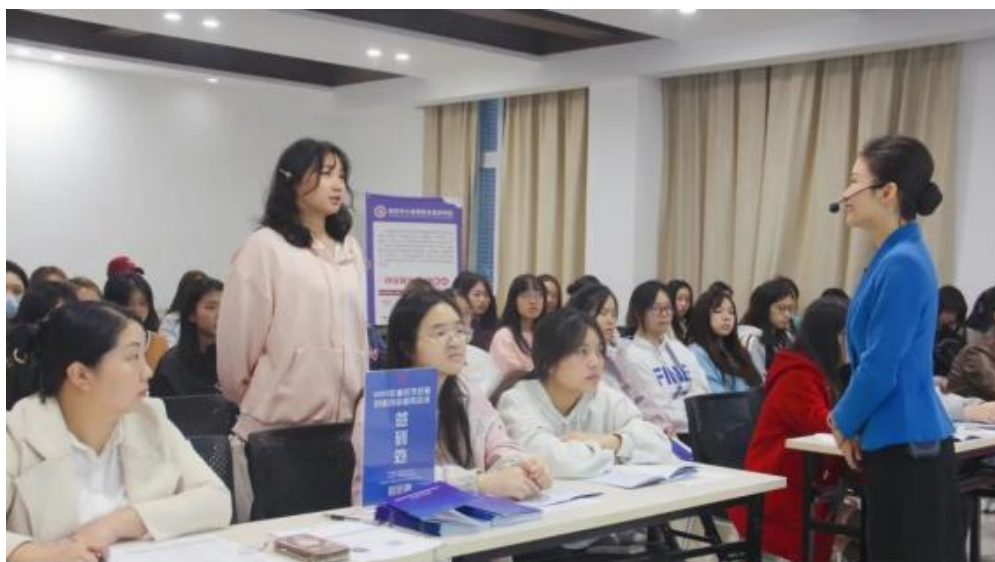
图 2-5 举办女大学生就业创业培训

开展就业讲座与培训。邀请重庆市就业指导专家、行业企业成功人士来校为毕业生开展就业创业专题讲 68 场。