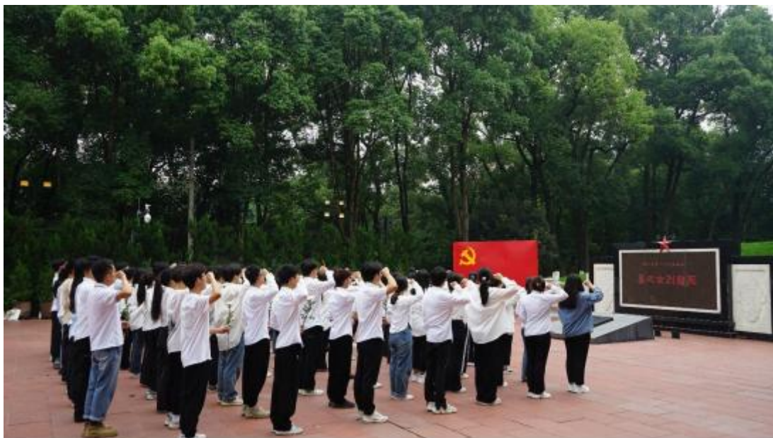
图 4-1 青年学生歌乐山烈士陵园宣誓

“一站式”社区优秀影片展映活动等文化文艺活动。学校辩论队荣获重庆市“校园之春”大学生辩论赛（专科组）三连冠；荣获市商务系统演讲比赛一等奖、“七一”文艺汇演一等奖、演讲比赛第一名等荣誉。