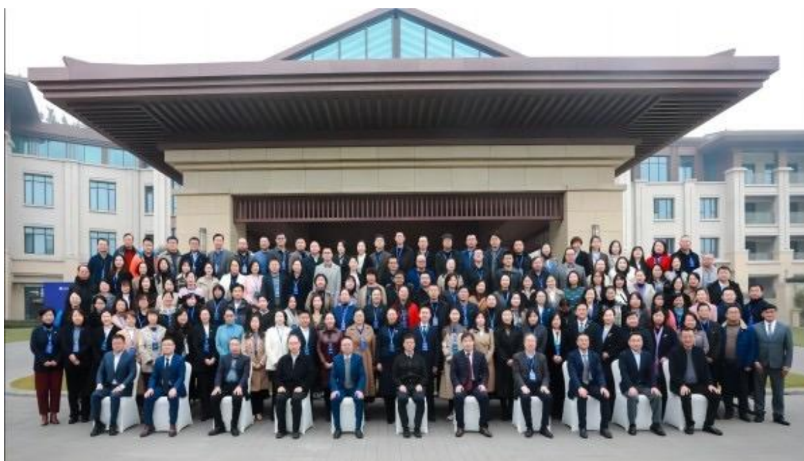
图 6-3 中国服务（数字文旅）产教融合共同体成立