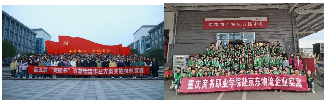
图 2-10 电子商务学院学生社团活动

三是以学生社团为抓手，课余活动特色化。学生社团是现代物流管理专业第二课堂载体，定期组织“商院杯”智慧物流作业方案设计与实施大赛、供应链沙盘模拟大赛、物流企业调研、助力双十一快递等活动，把教学内容运用于实战中、比赛中，有效提高了学生的综合素质，对课程教学形成有力补充。