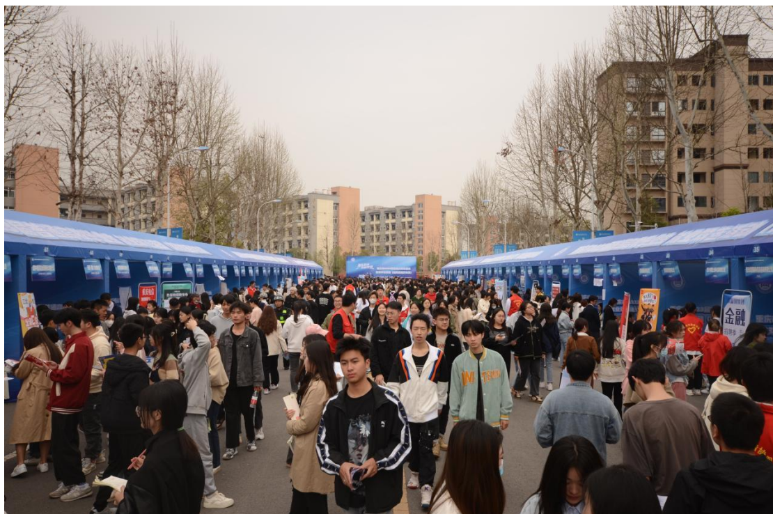
图 2-4 2023 届毕业生校园双选会

开展就业讲座与培训。邀请重庆市就业指导专家、行业企业成功人士来校为毕业生开展就业创业专题讲 68 场。