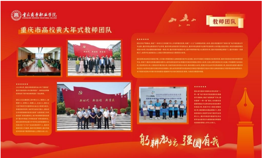
图 2-1 重庆市高校黄大年式教师团队

培训、归国留学人员培训、岗前培训、暑期教师研修、哲学社会科学教学骨干培训等 30 余个专题,师资培训覆盖率 90% 以上。加大对“双师型”教师培养培训基地和企业实践基地的建设,建有 8 个“双师型”教师培养培训示范基地、4 个市级职业技能竞赛选拔集训基地。充分发挥带徒传技、人才引领作用,鼓励学校教师积极参与职业技能提升、职业技能竞赛、技能人才评价、职业院校发展、技能服务社会等,2023 年度成功申报为市级技能大师工作室,学校已连续 3 年获批市级技能大师工作室。