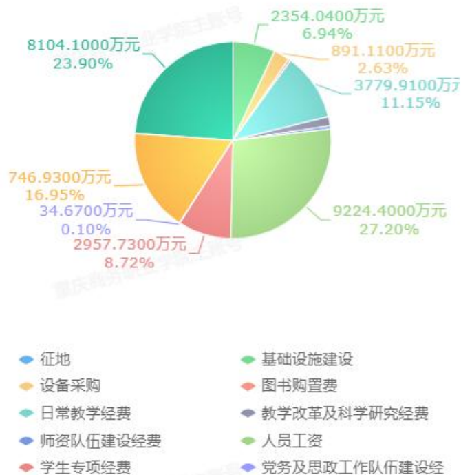
图7-2 2023年学校办学经费支出情况