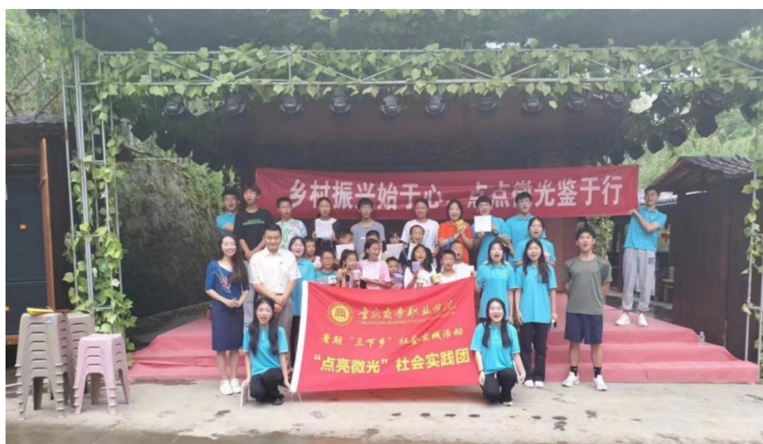
图 3-5 大学生“三下乡”社会实践等志愿者服务活动

活动,覆盖师生千余人,捐赠生活学习用品价值 2.84 万元的,在北屏乡中心小学挂牌成立“心理送教下乡”共建单位。学校“呵护美丽童心”——送教下乡助力乡村人才振兴项目荣获重庆市高校“十佳学生社团项目品牌”。三是对城口籍在校贫困生优先给予学费减免、勤工助学、节日慰问等资助,共计 2.57 万元。四是在政策允许的条件下优先录取 37 名城口县籍的学生,针对 29 名农村低收入家庭学生优先给予“一对一”就业帮扶。五是支持城口县电商企业开展校园招聘活动,与城口县咸宜印象电子商务服务中心、特色民宿红豆书院等民营企业开展访企拓岗,邀请城口县九重山水有限公司来校参加毕业生就业双选会。