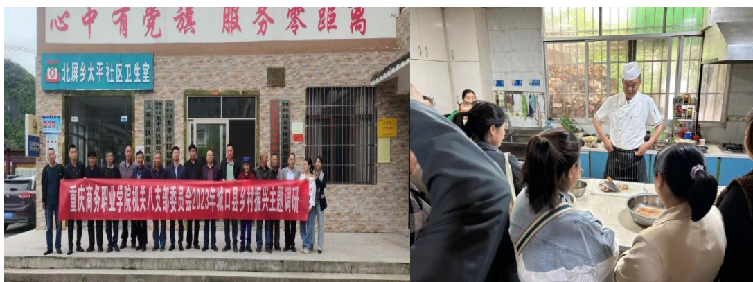
图 3-2 支部共建及开展厨师培训

3.3.2 消费帮扶助力村民增收。 一是通过采购农产品消费帮扶。通过线上线下采购完成消费帮扶共 60.185 万元，其中城口县 34.1512 万元，万州恒合土家族乡 20 余万元，超额完成消费帮扶任务。二是利用专业优势助力农产品销售帮扶。学校充分发挥在电子商务产业链的专业优势，强化校地合作、校企合作，为推进重庆“数商兴农”行动，通过直播活动和实践课程帮助销售大量城口腊肉、香肠、黑土豆等产品，远销北京、广东、山东等 8 个省市。