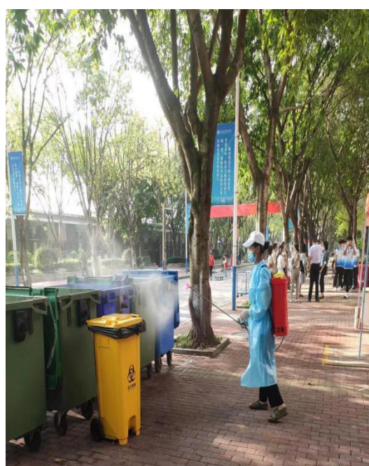
对校园进行消毒消杀