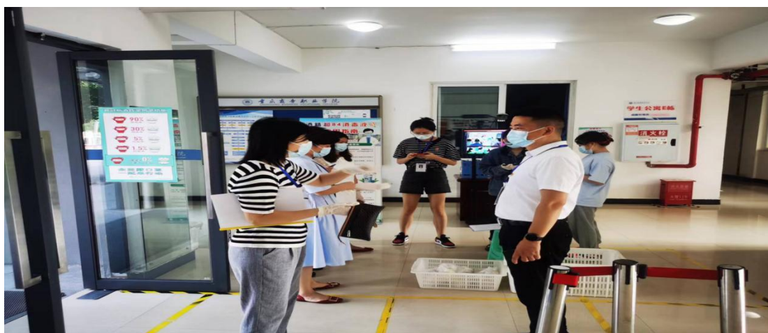
对新生宿舍进行消杀检查