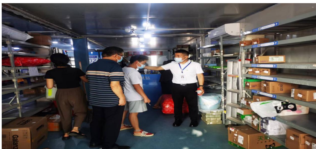
对菜鸟驿站进行消杀检查