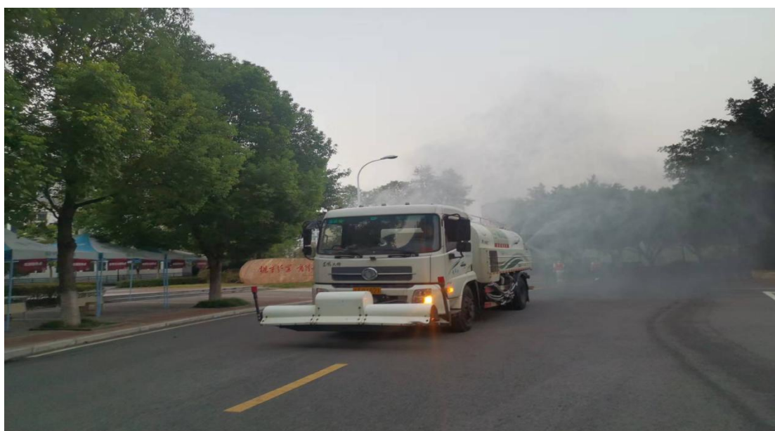
炮雾车对全校主干道进行消毒消杀