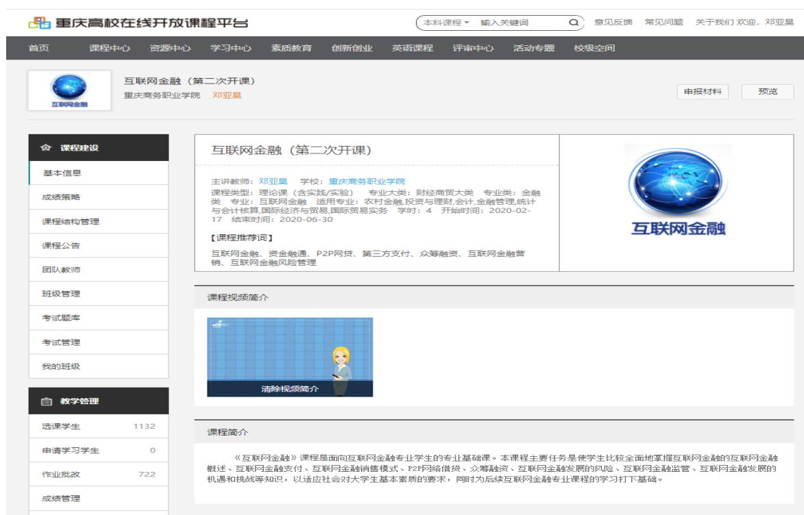
《互联网金融在线开放课程》

沟通，指导学生的学习任务，制定学习安排，及时了解学生在家学习情况，督促学生按时学习、完成作业，并做好了学生心理辅导和健康指导，帮助学生消除消极心理。本着“离校不离学、停课不停教”的授课宗旨，课程团队根据课程特色结构，采取了思政课程教学+实践教学的模式，让学生利用手机 app 进行实践操作，引导学生思考的同时，也意识到了思想政治元素的内容。同时，线上课堂能够实时跟进学生学习的掌握情况，保障了课堂的效率，让学生真正有所学、有所悟、有所感、有所想，实现了线上教学的意义。