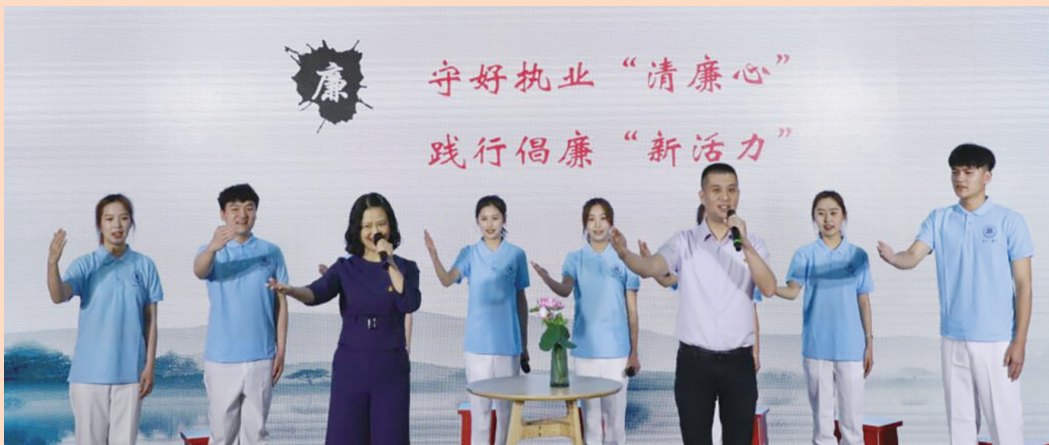
会计学院党总支《莲心·廉行》微党课展示

到大国工匠精神，从初心如磐到传承创新，重商人以学铸魂，坚定信念，坚信“职业教育前途广阔、大有可为”，在新时代、新征程、新赛道上奋力奔跑，书写“三步走”发展的新篇章。