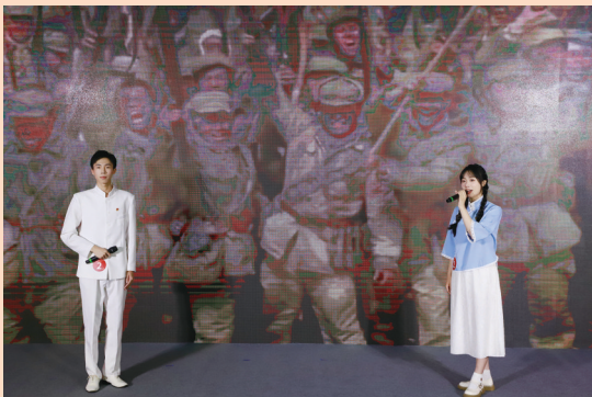
人工智能学院《红岩精神照初心 奋楫扬帆启新程》青春微课展示

微宣讲、微党课、微视频，不同样态的青春微课，在缙云山麓交响；红岩精神、工匠精神、创新精神，不同时代思想在三河水畔激荡。一个个青春微课，汇聚一堂既有青春颜值，又有红岩味、思政味的思政大课。近日，重庆商务职业学院举办“学思想、强党性、重实践、建新功”青春微课展示暨主题演讲比赛，在微宣讲、微党课、微视频和多样态的演讲中，师生同台，声情并茂，生动演绎，理想信念在学思践悟中更加坚定，初心使命在立德树人实践中有效践行。