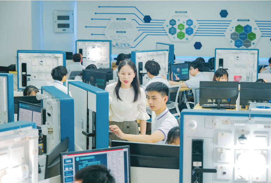
学校物联网应用技术专业学生正在上物联网智能家居应用技术实训课

“近年来,商务职业学院聚焦重庆市支柱产业和战略性新兴产业,接续打造‘三院一站’(博士后工作站)’,全面提升应用技术研发能力,加强商务经济政策研究、产业规划和咨询服务,立足职教之本,秉承工匠精神,以建设‘中科卓越班’为重点培养高端蓝领人才,商科工科并举,为重庆商务经济发展、乡村振兴和