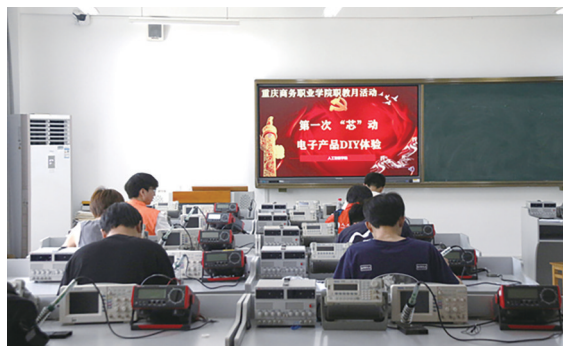
第一次“芯”动电子产品DIY体验活动

主题讲座以“百舸争流，云启未来”为主题，阐述了云计算技术应用对经济、社会发展的影响，以及云计算技术应用领域的变革和发展前景，特别是在推动传统产业转型升级、构建信息化和智能化社会等方面带来的技术革新。