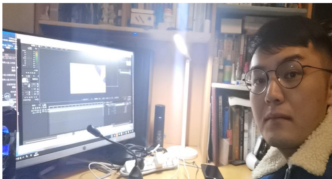
《网络主播向时雨老师》